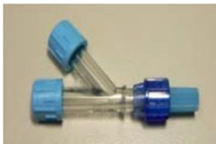
SPECTRA OPTIA SINGLE NEEDLE CONNECTOR