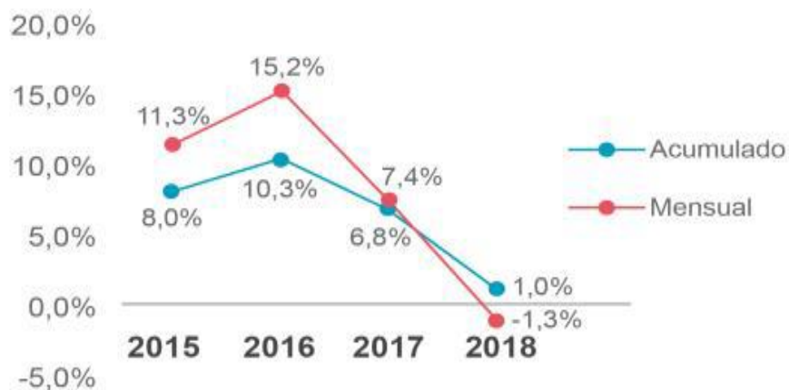
Gráfico N°2 Gobierno Central: Ingresos Tributarios Variación Interanual Mensual y Acumulada Junio 2015-2018

Los ingresos totales al cierre del primer semestre muestran un incremento de sólo 1,3% en relación con el año anterior (7,3%).