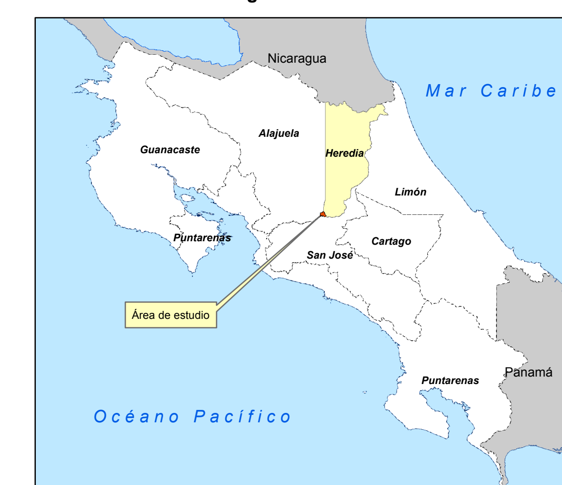
Diagrama de Ubicación