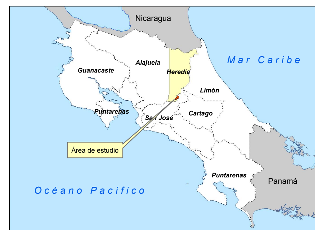
MATRIZ DE INFORMACIÓN DE VALORES DE TERRENOS POR ZONAS HOMOGÉNEAS PROVINCIA 4 HEREDIA CANTÓN 06 SAN ISIDRO DISTRITO DE SAN ISIDRO