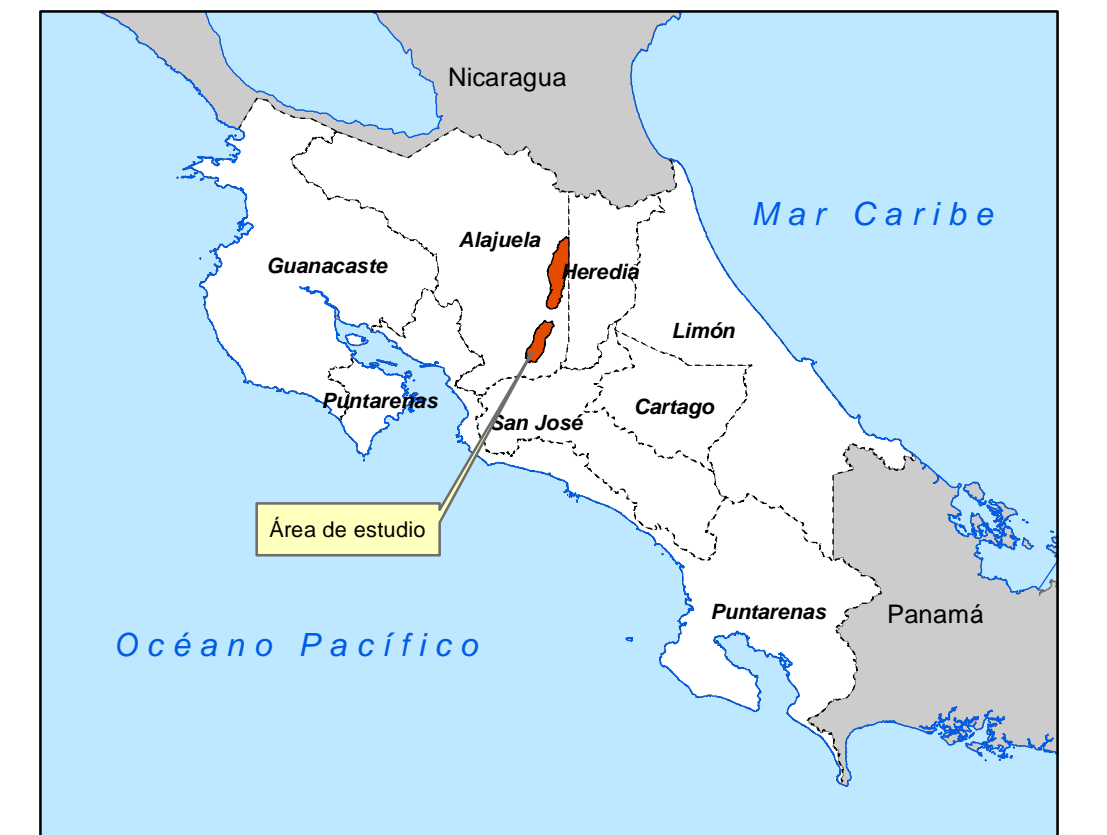
Diagrama de Ubicación